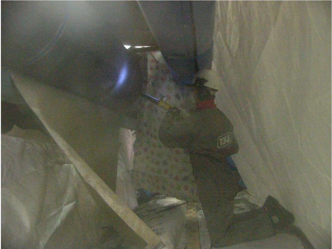
Sponge-Jet raepuhallus käynnissä. Tela on paperikoneessa paikoillaan.