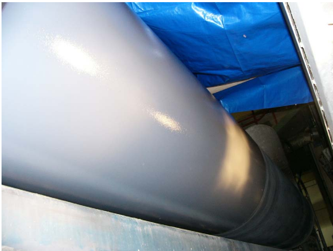
Valmista pinnoitettua pintaa. Telan kunnostus suoritettiin kahden päivän seisokin aikana. Kuva otettu pinnoitustyön jälkeen.