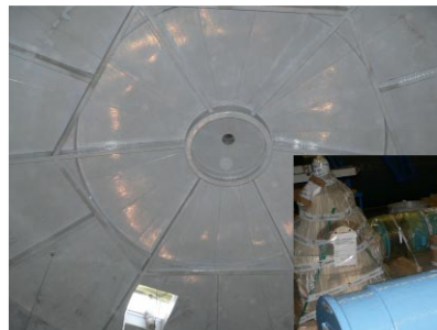
Prosessivesisäiliö pinnoitettu sisäpuolelta

Betoni- ja metallisäiliöt Lattiat Teräsrakenteiden ja laitteiden korroosiosuojaus Prosessilattiat, erityisesti elintarviketeollisuudessa