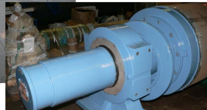
Korroosiosuojaus telapäätyihin. Eri värit mahdollisia.