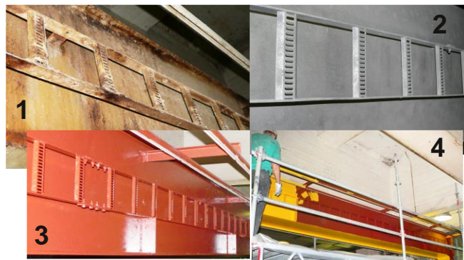
1) Korrodoitunut nosturiraami 2) puhalluksen jälkeen 3) ensimmäinen punainen kerros 4) lopullinen keltainen pinta.

Lastauslaiturit, liikuntasaumot, seinät, katot, turbiinisalit, varastot, kala-altaat mm. Pumput, tietyt paperikoneiden telat, telapäädyt, laivakannet, viemärit mm.